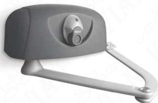
Rozměry pohonů HY7005/HY7024

24 V verze podporuje nejmodernější směry NICE: BLUEBUS, SOLEMYO a OPERA.